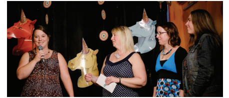
Les enseignantes de l'école de Bellecombe

Le coup de cœur des Prix de la culture de Rouyn-Noranda 2016 dans cette catégorie fut décerné à l' équipe d'enseignantes de l'école de Bellecombe .