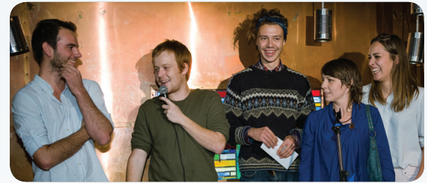
Membres du Collectif Parsi Parla

Le coup de cœur des Prix de la culture de Rouyn-Noranda 2018 dans cette catégorie fut décerné au Collectif Parsi Parla pour la Forêt numérique .