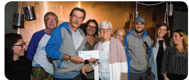
Membres du Comité du 40 e anniversaire de la descente des radeaux

Le coup de cœur des Prix de la culture de Rouyn-Noranda 2018 dans cette catégorie fut décerné au Comité des loisirs de Cléricy et à la Corporation de l'Opéra des Rapides .